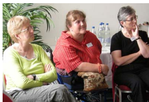
Spannende Referate, aufmerksame Zuhörerinnen.

Dahinter steht die (berechtigte) Überlegung, dass auch ein kämpferisch und selbstbewusst auftretendes Opfer ein Opfer ist. Doch wie, wenn nicht mit realen